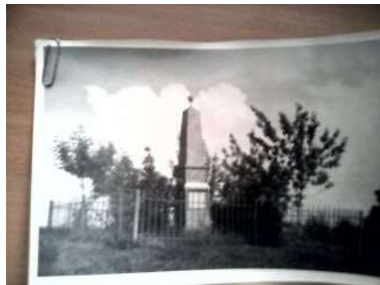
Братская могила трем воинам, погибшим в борьбе с колчаковцами в 1919 году во время форсирования реки Вятки