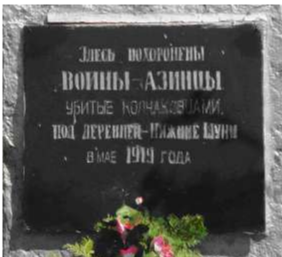
Надпись на могиле