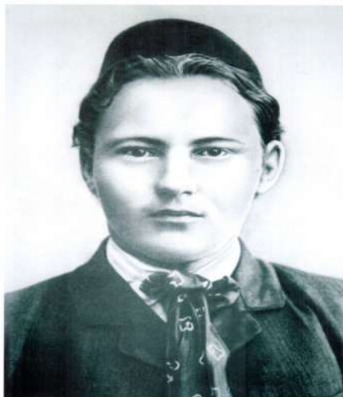
Габдулла Тукай (1886-1913)