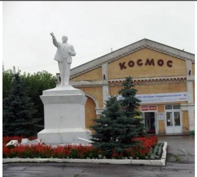
6. Памятник В.И.Ленину на Соборной площади