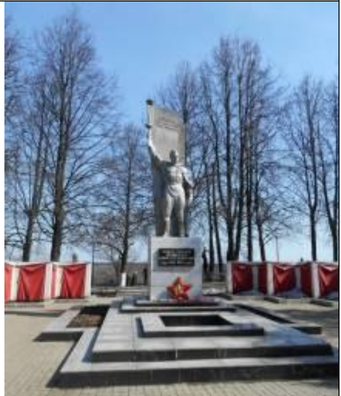
8. Мемориальный комплекс, посвящённый слобожанам, погибшим в годы Великой Отечественной войны