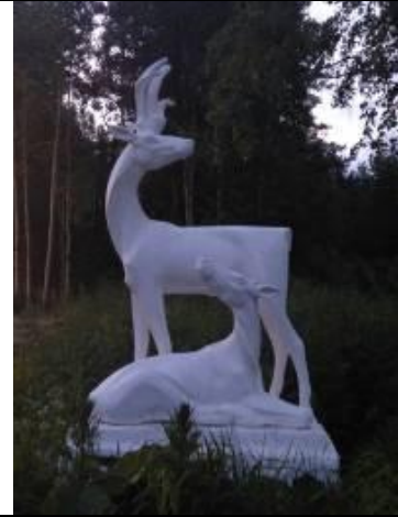
14. Скульптура оленихи с оленёнком (сохранена)