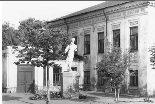
15. Скульптура девушки-гимназистки