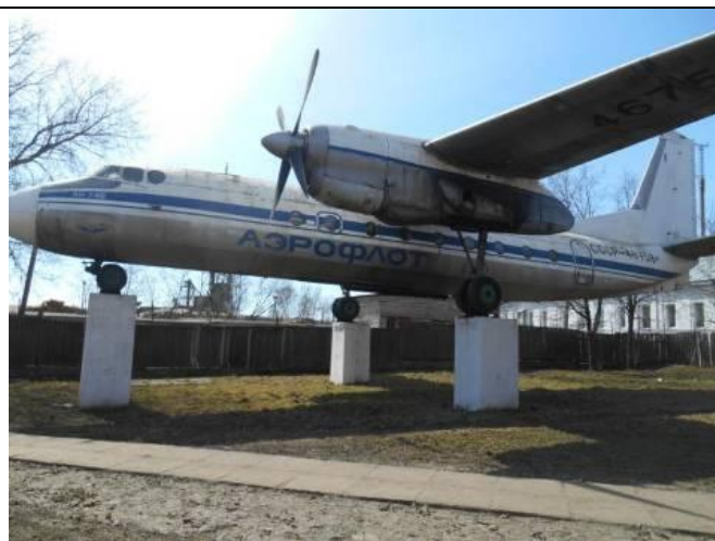
2. Памятник самолёт АН-24