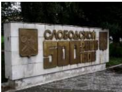
11. Стела к 450-летию города у автостанции и обновлённая стела в центре города(ул.Никольская)