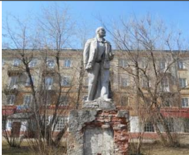
5. Памятник В.И.Ленину в сквере на ул.Советской