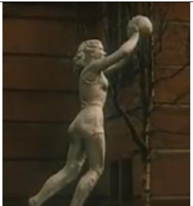
12. Скульптура спортсменки у Никольской церкви (бывшей ДЮСШ)