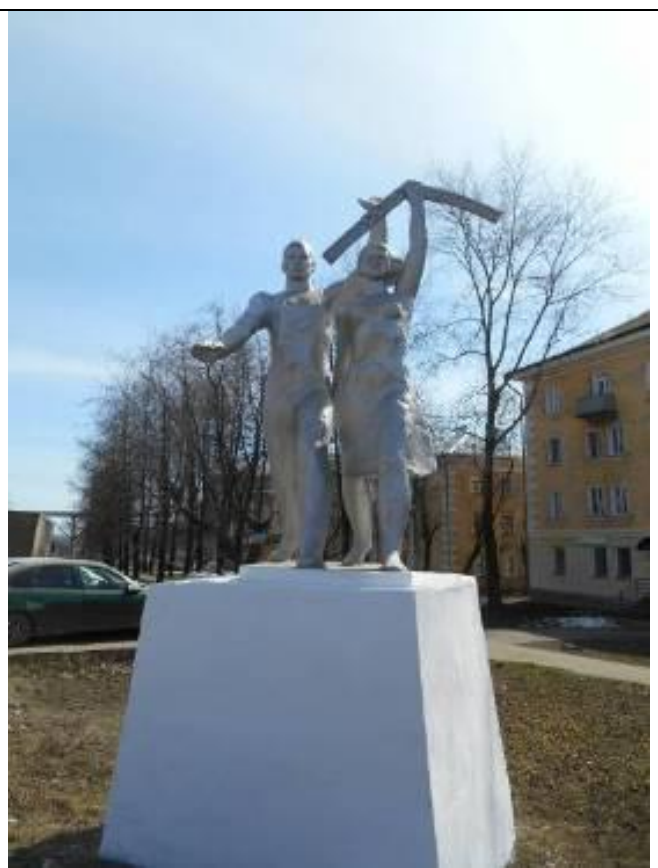
4. Памятник рабочему и колхознице