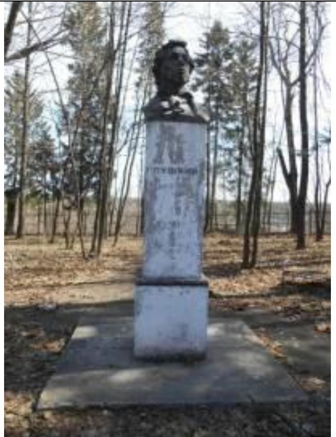
10. Памятник А.С.Пушкину в детском парке