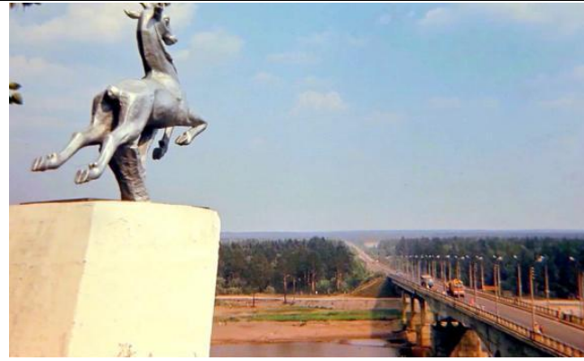
13. Скульптура оленя