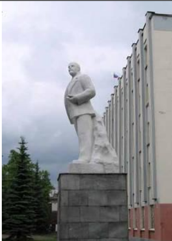
7. Памятник В.И.Ленину у здания администрации