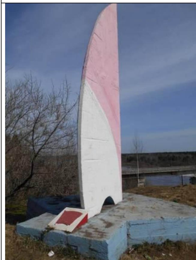
3. Обелиск «Алый парус»