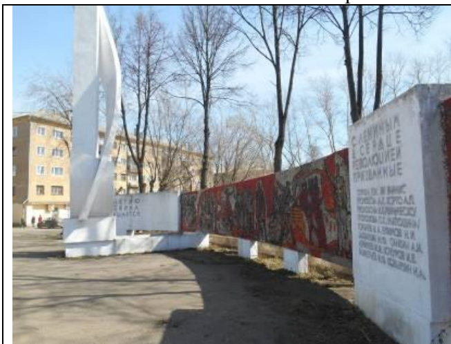
1. Стела к 100-летию В.И.Ленина