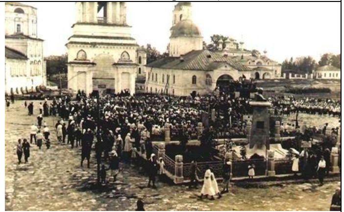
16. Бюст Ленину на главной площади