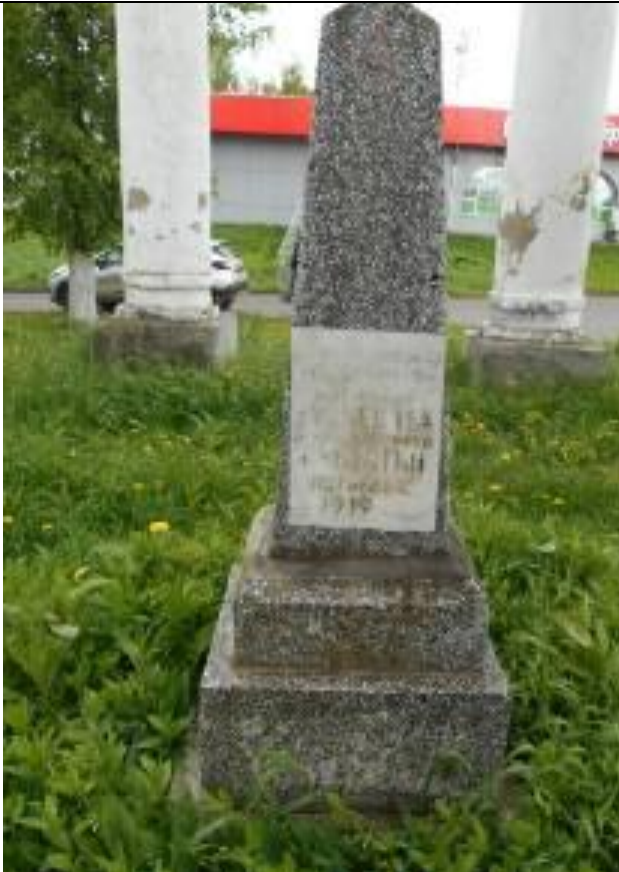
9. Памятник красноармейцам у Соборной площади