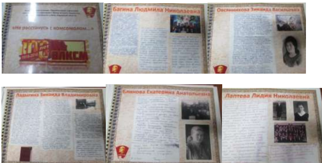
Приложение 7 (стр. 5)

Фото 20-22. В музее поисковой деятельности «Плацдарм».