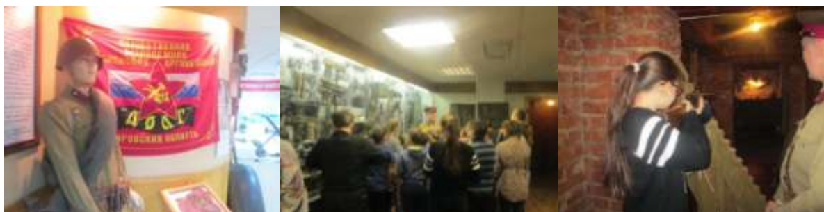
Приложение 8 (стр.9)

Фото 20-22. В музее поисковой деятельности «Плацдарм».