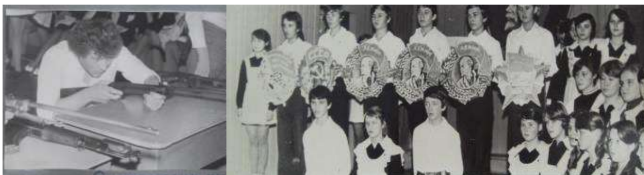
Фото 10. Вечер «Юность комсомольская моя» 19