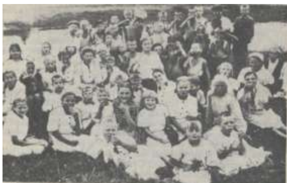
Фото 3. На фото воспитанники Медянского комсомольского детского дома

В настоящее время деревянного здания школы не существует. На этом месте стоит памятник погибшим медянкам в годы Великой Отечественной войны.