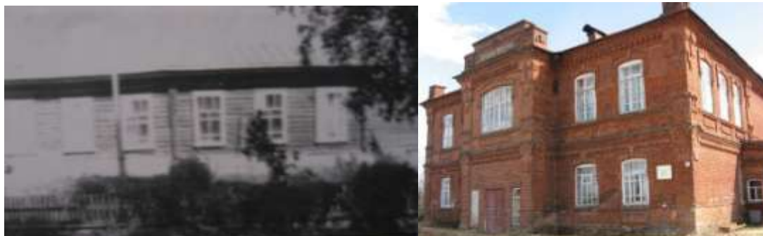
Фото 1-2. Здания школы в военное время

работала завхозом детского дома). Детский дом был рассчитан на 100 ребятишек. Уже в августе 1942 года приехала первая партия ребят в количестве 17 человек. Детский дом стал называться «Детский комсомольский детский дом № 35», т.к. шефами были комсомольцы Горкома Комсомола. В течении 2-х лет детский дом существовал исключительно на средства комсомола. Воспитанники учились с местными ребятами в здании деревянной школы.