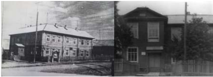
Фото 3-4. Почтовый транспорт 70-80-х годов