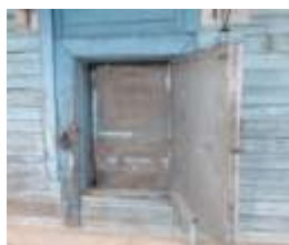
Окно для приемки и выдачи почты