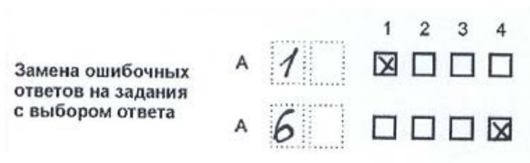
Рисунок 5. Пример замены неверного ответа на задания типа «А»

В случае если в поля замены ошибочного ответа внесен несколько раз номер одного и того же задания, будет учитываться последнее исправление (отсчет сверху вниз и слева направо). Например, на рисунке 6 в ответе на задание А3 в качестве правильного ответа выбран третий вариант и поставлена соответствующая метка. Чтобы исправить такой ответ (допустим, этот (третий) вариант ответа неправильный), в области замены ошибочных ответов обозначаем номер задания и ставим новую метку, например, второй вариант ответа (рис. 6).