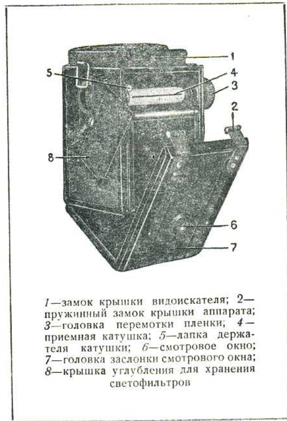
1—замок крышки видоискателя; 2—пружинный замок крышки аппарата; 3—головка перемотки пленки; 4—приемная катушка; 5—лапка держателя катушки; 6—смотровое окно; 7—головка заслонки смотрового окна; 8—крышка углубления для хранения светофильтров

1. Установить объектив на фокус по резкости изображения на матовом кружке или по шкале расстояний.